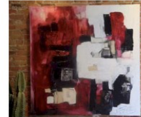
Nelligan vu par Dominique Payette Page 12